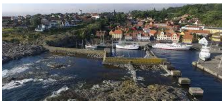
Udsigt over Gudhjem

Turen starter med at vi kører til Østerlars Rundkirke , Bornholms største rundkirke. Herfra videre til Gudhjem, en af Danmarks smukkeste beliggende byer. Her bliver der et ophold, til at se byen på egen hånd. Derefter videre til Helligdomsklipperne, her gøres ophold hvor der er mulighed for at spise den medbragte mad samt se klipperne og ”den sorte gryde”. Turen fortsætter videre igennem Tejn, Sandkås og tvillingebyerne Allinge-Sandvig til Hammershus slotsruin, hvor der er ophold for at se på borgen. Herfra videre til Vang hvor der er mulighed for at vandre til Jons Kapel. Derefter går turen hjemad, forbi Ruts Kirke igennem Klemensker, Årsballe, Østerlars og Østermarie.