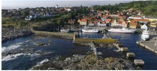
Udsigt over Gudhjem

Fra Rønne kører vi gennem Hasle Lystskov og Hasle til Johns Kapel herfra går I til Vang. Fra Vang kører vi til Hammershus hvor der er mulighed for at spise den medbragte madpakke samt se på borgen. Videre gennem tvillingebyerne Sandvig og Allinge, op langs kysten til Helligdomsklipperne, hvor der er ophold til at se klipperne og ”den sorte gryde”. Herefter videre til Gudhjem, en af Danmarks smukkeste beliggende byer. Her bliver der et ophold, til at se byen på egen hånd. Herfra kører vi til Østerlars Rundkirke Bornholms største rundkirke, som er vores sidste stop i dag.