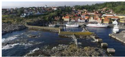
Udsigt over Gudhjem

I stedet for Natur Bornholm kan man besøge Rønne By eller Bornholms Rovfugleshow