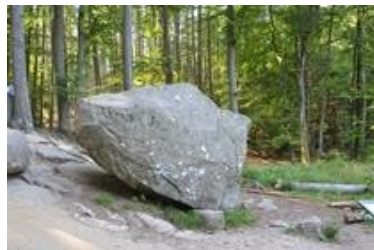
Rokkestenen i Paradisbakkerne

Som alternativ til Brændesgårdshaven, kan man vælge enten Natur Bornholm i Åkirkeby, som er et natur- og oplevelsescenter, der gennem interaktive udstillinger, virtuel teknologi, samt naturvejledning har til formål at styrke interessen og forståelsen for øens natur og kultur. Eller Bornholmertårnet på Dueodde det er et oplevelsescenter hvor I medguide oplever et tidligere totalt hemmeligstempelt militært område. Det blev åbnet første gang for offentligheden i foråret 2015. I NATO's tidligere lyttepost er der lavet en stor billedudstilling, som fortæller om 2. Verdenskrig og Bornholms helt særlige rolle, hvor øen blev bombet efter Danmarks befrielse; og især om "Den Kolde Krig" og dens betydning for øen