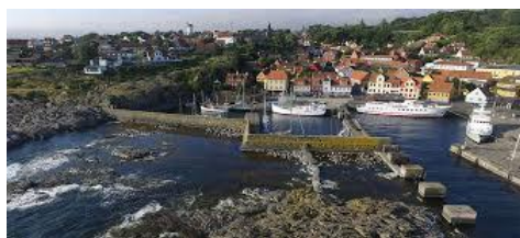
Udsigt over Gudhjem

I stedet for Natur Bornholm kan man besøge Rønne By eller Bornholms Rovfugleshow