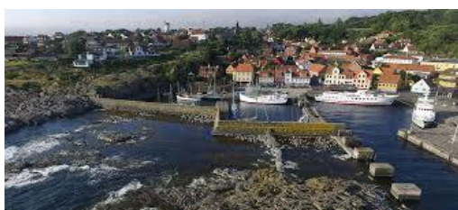
Udsigt over Gudhjem

Turen starter med at vi kører til Østerlars Rundkirke , Bornholms største rundkirke. Herfra videre til Gudhjem, en af Danmarks smukkeste beliggende byer. Her bliver der et ophold, til at se byen på egen hånd. Derefter videre til Helligdomsklipperne, her gøres ophold hvor der er mulighed for at spise den medbragte mad samt se klipperne og ”den sorte gryde”. Turen fortsætter videre igennem Tejn, Sandkås og tvillingebyerne Allinge-Sandvig til Hammershus slotsruin, hvor der er ophold for at se på borgen. Herfra videre til Vang hvor der er mulighed for at vandre til Jons Kapel. Derefter går turen hjemad, forbi Ruts Kirke igennem Klemensker, Årsballe, Østerlars og Østermarie.